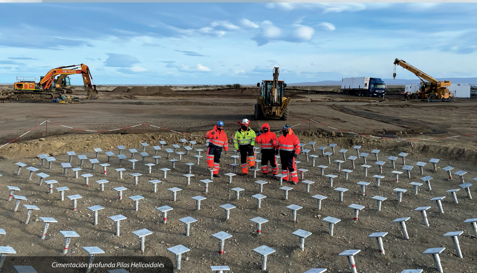
Cimentación profunda Pilas Helicoidales