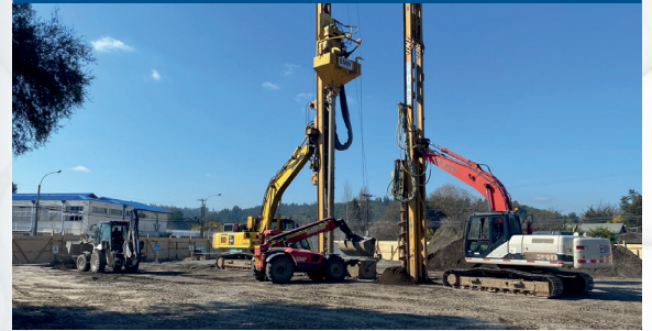
Mejoramiento, movimiento de tierras y Muro Berlínés colegio Alonso de Ercilla